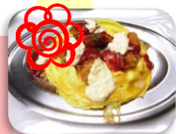
ハントンライス (石川県)

これからも、皆さんがより楽しみになるようなメニューを提案していきますので期待してくださいね！ 次の特別企画は3月のつばさ会の予定となっています。お楽しみに！！