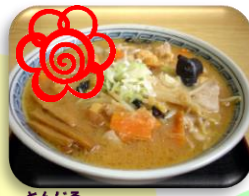
豚汁ラーメン (新潟県)

各シリーズから勝ち上がったのは、こちらのメニューでした！早速、10月の献立に登場し、各地に行った気分になりながら頂きました♪