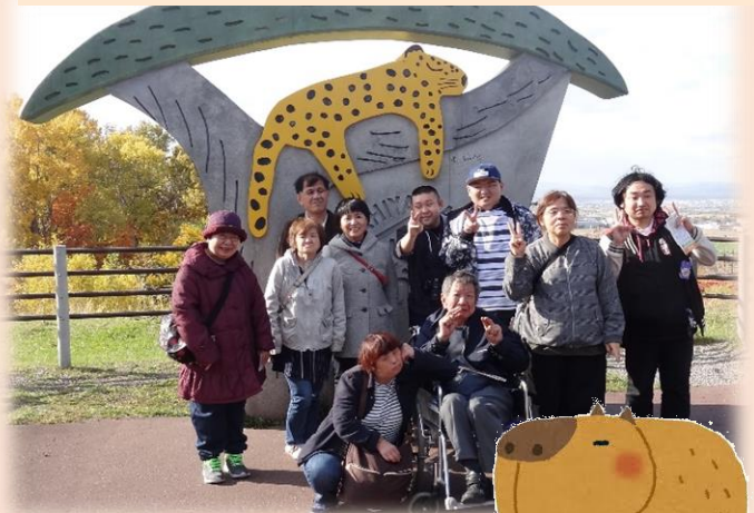
旭山動物園に行ってきました！