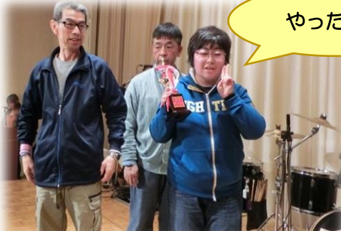
菊水ワーク団体優勝しました！