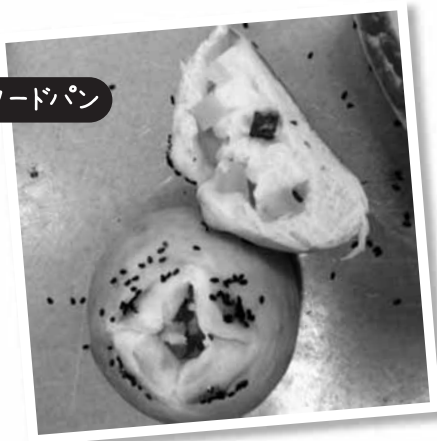
おさつカスタードパン