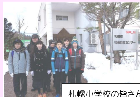
札幌小学校の皆さん