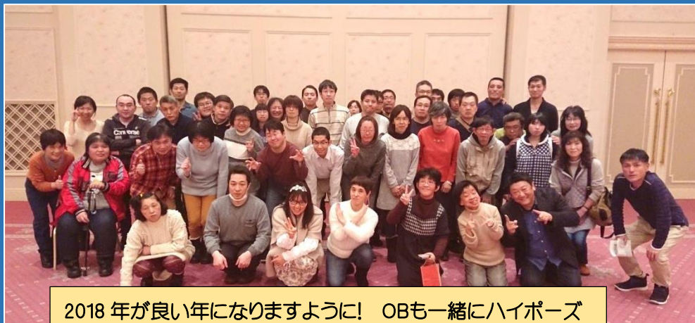
2018年が良い年になりますように! OBと一緒にハイポーズ