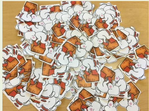
さつきたそう ジャンプ班

2018 年ゆめくるカレンダーただいま作成中です！来年の干支は戌年！かわいいワンちゃん達が JAZZ を奏でるデザインです♪まだ全然進んでいませんが広報に載せる事で自らお尻に火を点け頑張ります！ 乞うご期待！ (吉野)